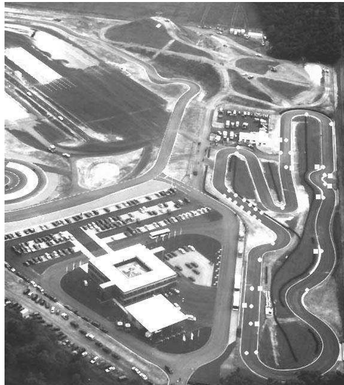
Ansicht RSG Kartbahn Embsen